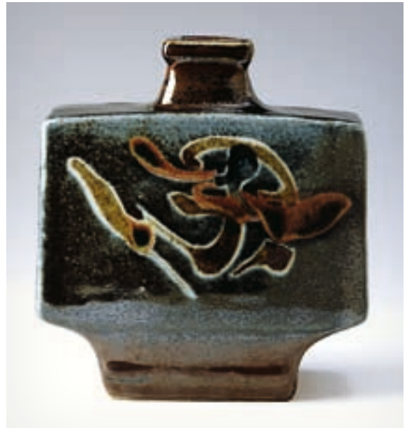
▲ Kawai Kanjiro: Palack , 1950, mázas kőedény, 21,6 × 19 cm (Scripps College, Claremont, Kalifornia, kat. szám L78.1.92)

Az 1972-től megjelenő Studio Potter féléves szaklap, mely a keramikusok első számú orgánumává vált,