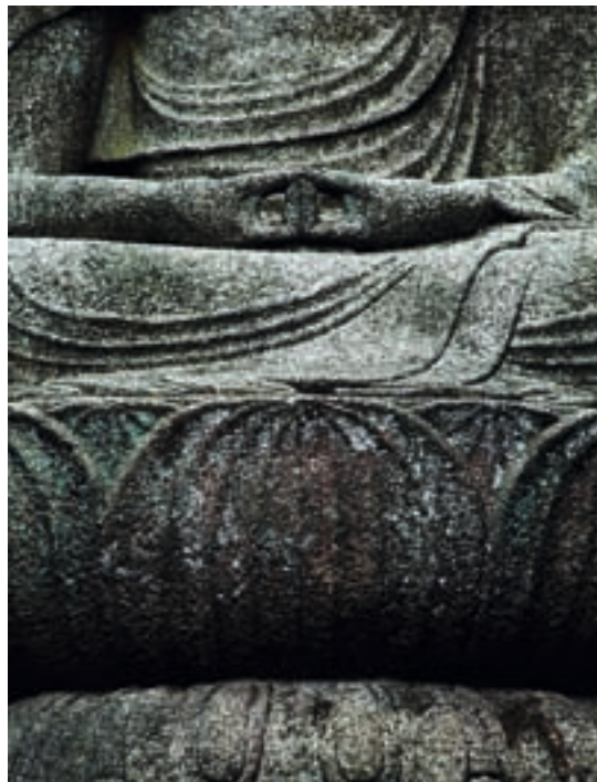
▲ Buddha-szobor részlete, Kiotó, Japán, 2005

A kézművesség nagyhatású manifesztójának van egy határozott kultúrkritikai vonulata. Az egyéni műalkotások másodlagos értékének és a sorozatgyártásnak az éles bírálata Yanagi azon meggyőződéséből fakad, hogy a kézművesség kultúrája egy olyan emberkép és közösségi életmód része, amely jobban megfelel az egészséges emberi természetnek, mint a magányos egyéniség és a tömeges ipar rossz konstrukciója. 35