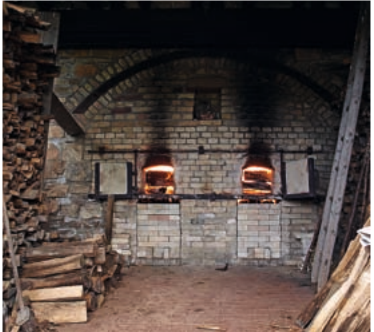
▲ A kemence két tűztére

▲ Metszetrajz a Kannofen kemence belsejéről