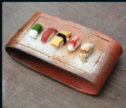
◀ ◀ Ovális tálalótál shigaraki agyagból, gazdag effektekkel