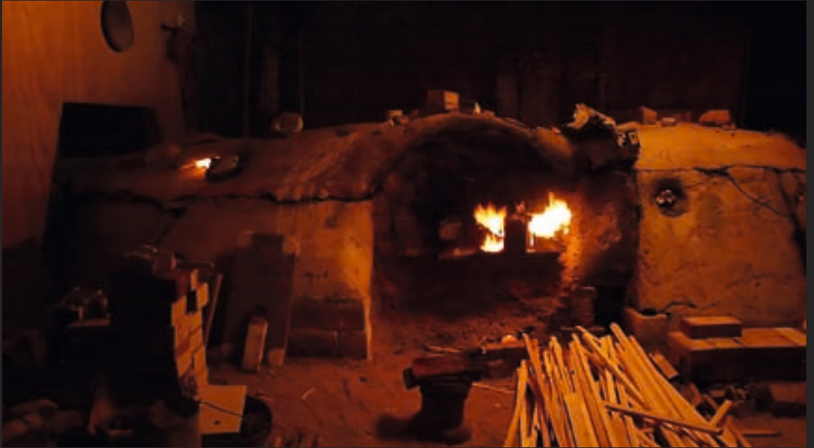
◀◀ A második kamrát égetem