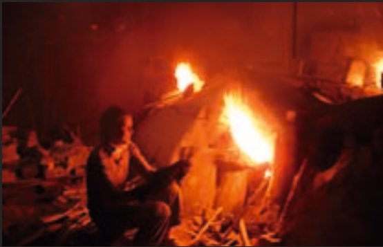
▼ Az égetés vége felé a kéményen kicsapó láng