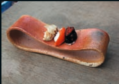
▼ Hullámzó táljaim lágy lángnyomokkal