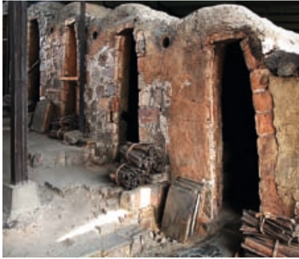
◀ Kawai Kanjiro kemencéje. Az egyik kamra belülről, valamint a kamrák sora kívülről a tüzeléshez előkészített fakötegekkel. Kawai háza és műhelye ma múzeum

(USC) részére, 1967-ben pedig háromkamrás kemencét épített saját stúdiójában.